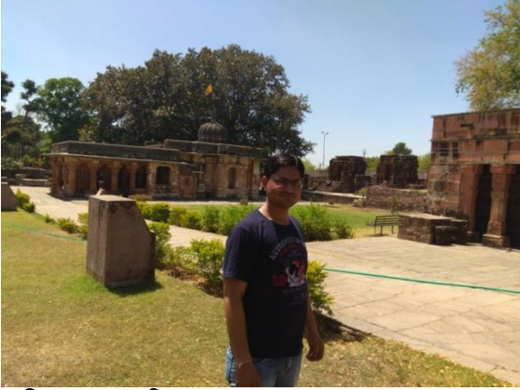
कालिका माता मन्दिर

कालिका माता मन्दिर (नवदुर्गा मन्दिर) में देवी के विविध रूपों चामुण्डा, महिषमर्दिनी आदि की उपासना होती थी। आज यह अत्यन्त जीर्ण-शीर्ण स्थिति में विद्यमान हैं। नवदुर्गा मन्दिर में देवी के भयानक रूपों को गरिमान्वित किया गया है। मन्दिर की प्रतिमाओं से बोध होता है कि यह क्षेत्र 8वीं-9वीं शताब्दी तक शक्ति पूजा का एक प्रमुख केन्द्र रहा होगा। यहाँ की कुछ प्रतिमाएँ झालावाड़ संग्रहालय में सुरक्षित है। 16 चन्द्रावती के महाकाली मन्दिर में संरक्षित 5 फीट की नग्न एवं भयानक अष्टबाहु देवी की प्रतिमा है। इसके छः कर भग्न है शेष दो करों में से उसने ऊर्ध्वकर में डमरू तथा अधोकर में एक उल्टे हुए पुरुष के दोनों पैर पकड़ रखे हैं। देवी के शीष पर मुकुट तथा नाभि में वृषिक का अंकन है। जो तंत्र साधना सूचक है। इनके पैरों के समीप दक्षिण व वाम पार्श्व में दो अन्य नग्न मूर्तियाँ, जो दषभुजी है। इसी क्रम में इनके निकट दो काली देवी की कंकाल सदृश्य मूर्तियाँ हैं जो अत्यंत भयानक है। इसके निकट ही एक द्विभुजी तथा दूसरी दषभुजी नग्न स्त्री मूर्ति है। सम्भवतः यह काली देवी के साथ योगिनी रूप में बनाई गई होगी। इन सभी देवियों के पृष्ठ भाग में वाहनरूप में गदर्भ की आकृतियाँ दिखाई देती है। इस भू-भाग में गदर्भवाहन देवी के साथ प्रदर्षित तो किया जाता था परन्तु तब तक देवी के आयुधों में पूलादि की गणना नहीं की जाती थी। सम्भवतः इसका षीतला के रूप में ऐसा स्वरूप प्रचलित रहा हो एवं कालान्तर में उसे नग्नावस्था तथा रासभासना रूप में प्रस्तुत किया गया हो। 17