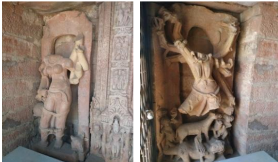
चित्र संख्या 4-7 : कालिका माता मन्दिर में संग्रहित प्राचीन प्रतिमाएँ

कालिका माता मन्दिर (नवदुर्गा मन्दिर) में देवी के विविध रूपों चामुण्डा, महिषमर्दिनी आदि की उपासना होती थी। आज यह अत्यन्त जीर्ण-शीर्ण स्थिति में विद्यमान हैं। नवदुर्गा मन्दिर में देवी के भयानक रूपों को गरिमान्वित किया गया है। मन्दिर की प्रतिमाओं से बोध होता है कि यह क्षेत्र 8वीं-9वीं शताब्दी तक शक्ति पूजा का एक प्रमुख केन्द्र रहा होगा। यहाँ की कुछ प्रतिमाएँ झालावाड़ संग्रहालय में सुरक्षित है। 16 चन्द्रावती के महाकाली मन्दिर में संरक्षित 5 फीट की नग्न एवं भयानक अष्टबाहु देवी की प्रतिमा है। इसके छः कर भग्न है शेष दो करों में से उसने ऊर्ध्वकर में डमरू तथा अधोकर में एक उल्टे हुए पुरुष के दोनों पैर पकड़ रखे हैं। देवी के शीष पर मुकुट तथा नाभि में वृषिक का अंकन है। जो तंत्र साधना सूचक है। इनके पैरों के समीप दक्षिण व वाम पार्श्व में दो अन्य नग्न मूर्तियाँ, जो दषभुजी है। इसी क्रम में इनके निकट दो काली देवी की कंकाल सदृश्य मूर्तियाँ हैं जो अत्यंत भयानक है। इसके निकट ही एक द्विभुजी तथा दूसरी दषभुजी नग्न स्त्री मूर्ति है। सम्भवतः यह काली देवी के साथ योगिनी रूप में बनाई गई होगी। इन सभी देवियों के पृष्ठ भाग में वाहनरूप में गदर्भ की आकृतियाँ दिखाई देती है। इस भू-भाग में गदर्भवाहन देवी के साथ प्रदर्षित तो किया जाता था परन्तु तब तक देवी के आयुधों में पूलादि की गणना नहीं की जाती थी। सम्भवतः इसका षीतला के रूप में ऐसा स्वरूप प्रचलित रहा हो एवं कालान्तर में उसे नग्नावस्था तथा रासभासना रूप में प्रस्तुत किया गया हो। 17