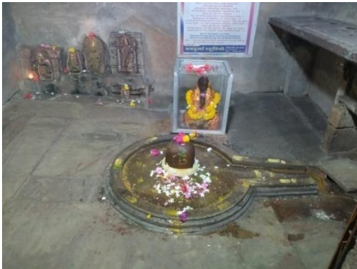
चित्र संख्या 1 : शीतलेश्वर महादेव मन्दिर

मन्दिर में एक खुला चौक, उपकक्ष तथा पूजाग्रह बने हुए हैं। मन्दिर अत्यन्त जीर्ण-शीर्ण अवस्था में है जिसके ऊपर छत नहीं है तथा भीतर छत का आधा भाग पूरी तरह गायब है। छत में उत्तम कोटी के मूर्ति पटल थे। गर्भगृह में शिवलिंग एवं हरगौरी की प्रतिमा सुशोभित हैं एवं प्रतिमाएँ पूर्ण रूप से सुरक्षित हैं। भारतीय पुरातत्व