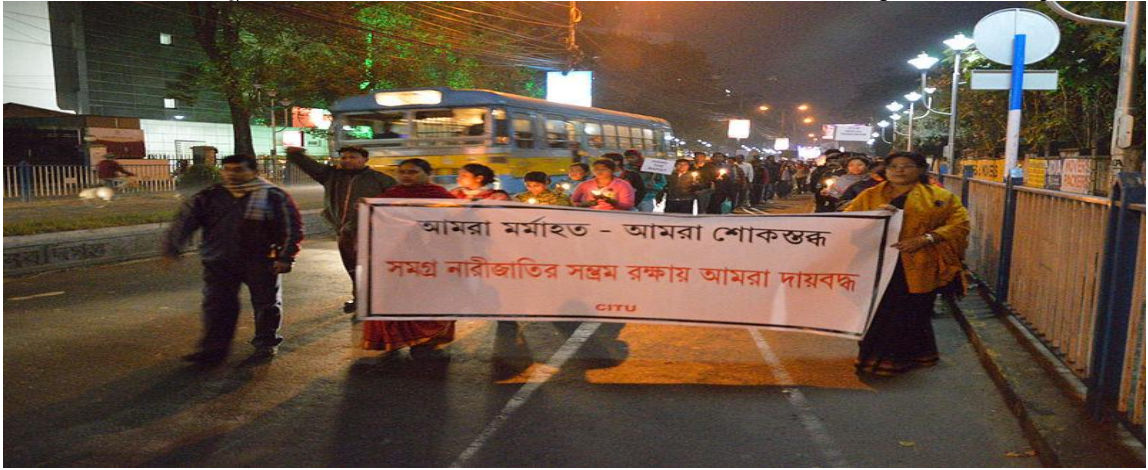
(दिल्ली के सामूहिक बलात्कार कांड के विरोध में कलकत्ता में हुए प्रदर्शन का एक दृश्य)